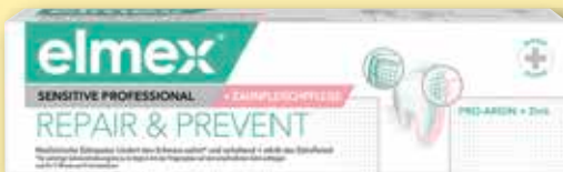
elmex ® Sensitive Professional ™ Repair & Prevent Zahnpaste