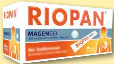
Riopan ® MagenGel

Achten Sie auf weitere Angebote in unserer Apotheke!