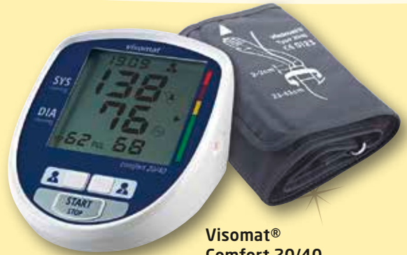
Visomat ® Comfort 20/40

Oberarm-Blutdruckmessgerät statt € 69,50 1)