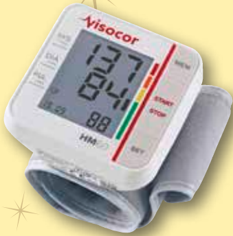
Visocor HM60 Handgelenk- Blutdruckmessgerät