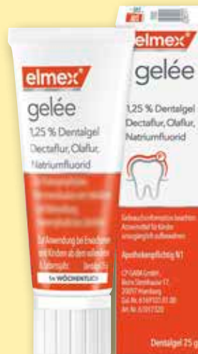
elmex ® Gelée